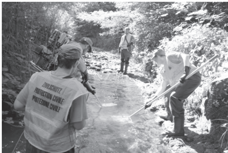
Umsiedlung von bedrohten Fischbeständen: Zivilschutzangehörige beim Ausfischen im Homburgerbach in Thürnen

führende Zusammenarbeit im vergangenen Jahr 2018 danken wir der Kommission ARGUS, den Gemeinden, den Werkhöfen, den Feuerwehren und den Samartervereinen im Verbund ARGUS, sowie dem Regionalen Führungsstab ARGUS und dem AMB.