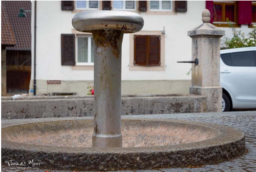
«Wenn Brunnen schweigen»