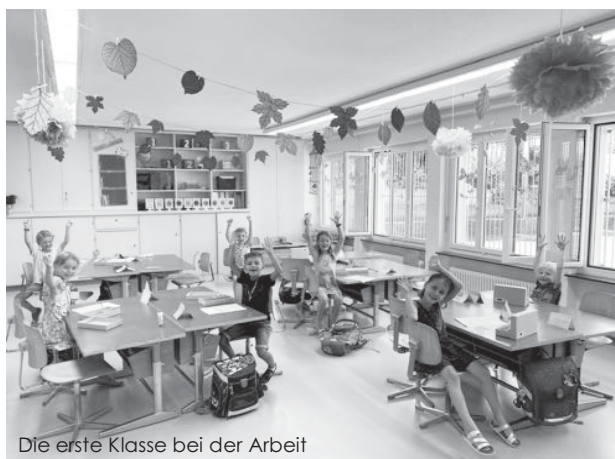
Die erste Klasse bei der Arbeit