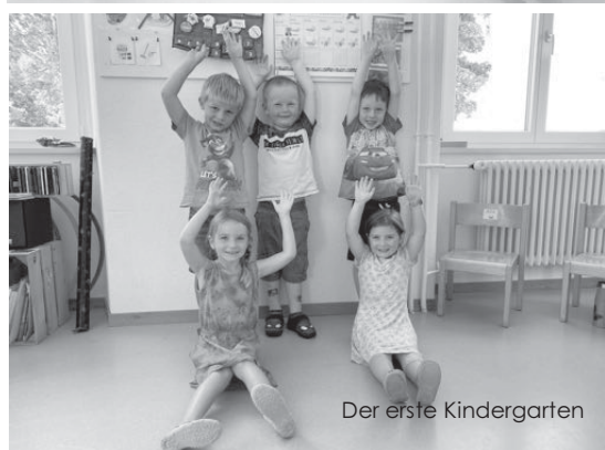
Der erste Kindergarten