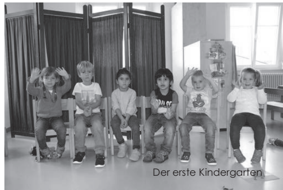
Der erste Kindergarten