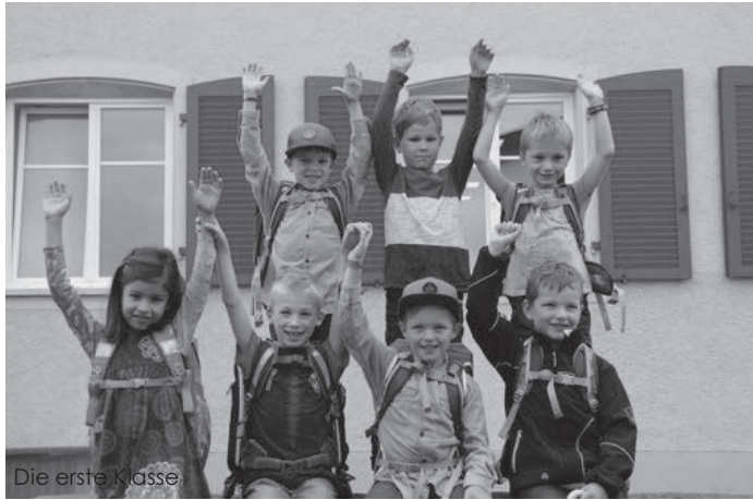
Die erste Klasse