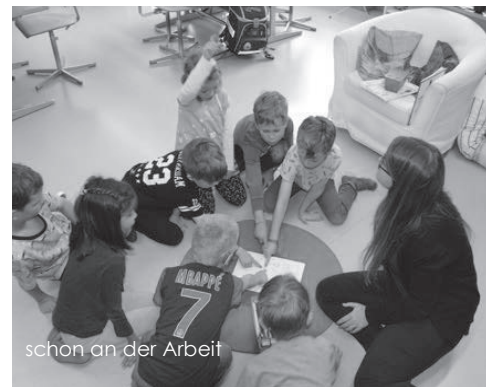
schon an der Arbeit