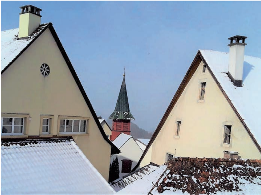
April macht, was er will.