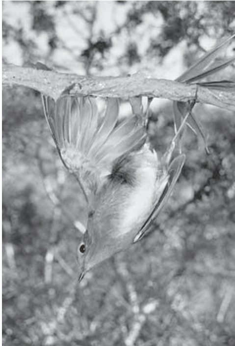
Rotkehlchen gefangen an Leimrute.