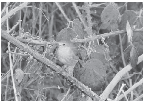
Rotkehlchen in sicherer Dornenhecke.

Wir sammeln Geld für den Schutz der Zugvögel in Italien, Zypern und der Schweiz. Helfen Sie mit einer Spende und besuchen Sie unseren Stand.