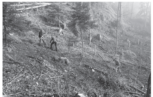
Auslichtung wird mit Sorbusarten neu bepflanzt