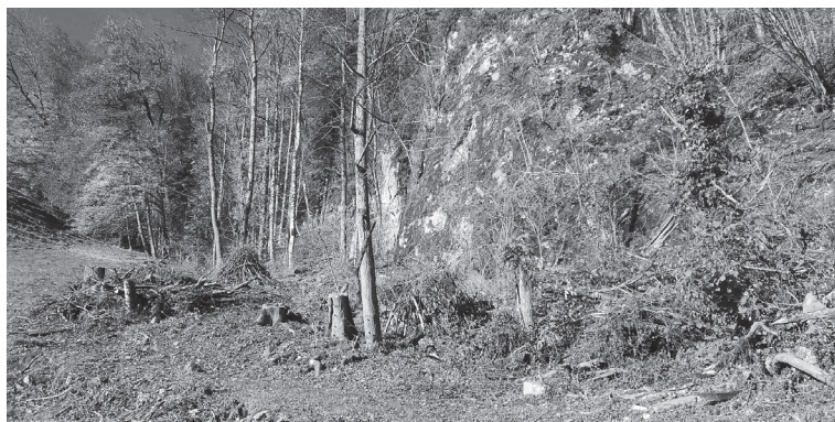
Freigestellte Felsen mit Asthaufen und Wieselburgen

Wir danken allen Sponsoren, dem Forstbetrieb und aktiven Helfenden nochmals für die wertvolle Unterstützung und freuen uns sehr auf die weitere Entwicklung dieses wertvollen Naturschatzes. Reptilien, Amphibien, Insekten, Vögel, Kleinsäuger, Blumen und Bäume, seid willkommen in eurem neuen Refugium!